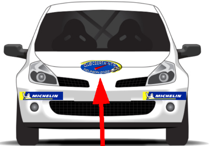
Logo club CEERTA - NRT 40 Cm